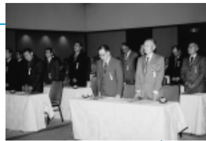
4月28日に行われた表彰式