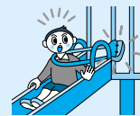
かた 肩かけカバンやランドセルをせおったまは×

公園で壊れている遊具を見つけたときなど、お気づきの点がありましたら、公園課公園施設管理センターへご連絡ください。tel(866)2445