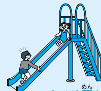
すべり面から のぼるのは×