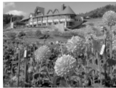
秋田国際ダリア園は10月が見ごろ！！

定員は両日とも20人(定員を超えた場合は抽選)。参加無料ですが、入園料400円が別に必要です。