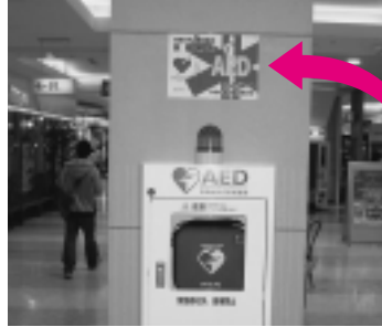
御所野のイオン秋田ショッピングセンター