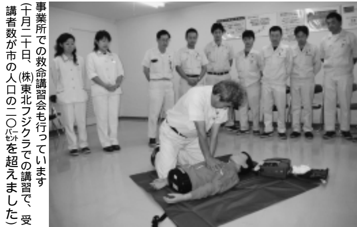
事業所での救命講習会も行っています 十月二十日、(株)東北フジクラでの講習で、受講者数が市の人口の二〇パーセントを超えました

和田幼稚園 就園前の親子が対象です。クッキー&パンづくり。1月13日(土)午前9時～11時、河辺総合福祉交流センターで。材料費実費。申し込みは和田幼稚園tel(882)2167