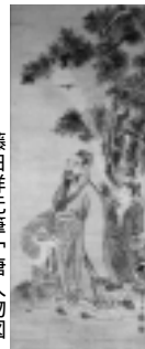
藤田祥元筆「唐人物図」

問い合わせ 太平山スキー場オープスtel(827)2221 クアドームザ・ブーンtel(827)2301