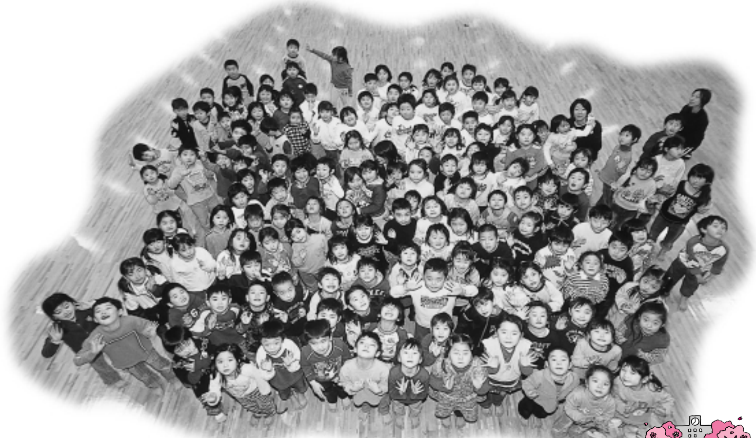
小学校のお兄さん、お姉さん、4月からよろしくね（中央ブロック保育所合同運動会で）