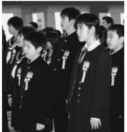
学校や地域に誇りを持って (3月15日、仁井田小学校の卒業式)

姉妹都市交流を促進：提携25周年にあたる中国・蘭州市の代表団を招待するほか、ロシア・ウラジオストク市やアメリカ・キナイ半島郡など、友好姉妹都市等との交流を進めます 予算 382万円