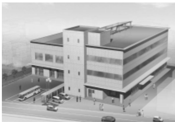
(仮称)西部地域市民サービスセンター 完成予想イメージ

(仮称)西部地域市民サービスセンターを着工…市民協働、都市内地域分権の拠点となる、支所、公民館、コミセン、子育て、地域防災機能などを備えた施設です。平成21年4月に完成予定です 予算 9920万円 (仮称)北部地域市民サービスセンターの建設整備計画を策定…西部地域に続き、北部地域に整備します。21年度の着工をめざし、地域との話し合いを重ねながら、建設基本計画をつくります 予算 820万円 旭南地区コミュニティセンターの建設準備…健全な自治活動の振興をはかるため、建設を予定している旭南地区コミセンの調査設計を行います。建設にあたっては、旭南児童館との複合建設とします 予算 513万円 公立保育所の一時保育がリフレッシュなどにも対応…パート勤務などで利用できる1日5時間までの短時間保育(18ページ参照)、緊急対応の一時保育のほかに、リフレッシュや就労で利用できる一時保育が加わりました 予算 1597万円