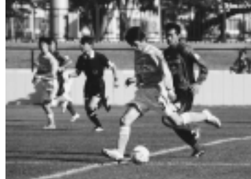
昨年は6競技のリハーサル大会が行われました