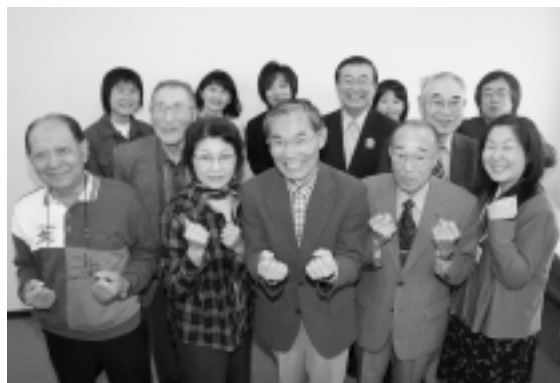
「人生いよいよこれから！」。4月15日、秋田シニアクラブの3分間スピーチ大会で夢を語ったみなさん