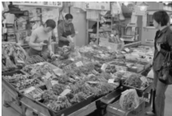
ずらっと並んだ山の恵み。あいこ、しどけ、ほんな、ミズ...、今日はどれにしようかな。(秋田市民市場)

しかし、手間が苦にならないほど山菜というものはなんと美味しいのだらうと実感できる食べ方があります。新鮮なうちに処理した山菜と、栽培ものの市販野菜を一緒の食卓に並べ、両方を食べ比べれば、もちろん山菜と野菜のジャンルは異なるものの、味の深さ、香り、歯ごたえ、みずみずしさがあまりに違い、一般の市販野菜には全く善が向きません。丹誠込めて野菜を作っている農家のかたには申し訳ありませんが、とかく最近の野菜類は、私が子ども時代に口にしたもの比べ柔らか過ぎで、味も香りも淡泊になり過ぎたような感じがします。これも、日本人の好みが変わってきたことや、規格・