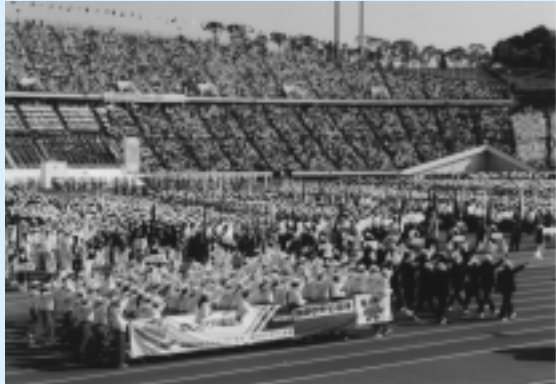
昨年、「兵庫のじぎく国体」開会式