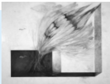
伊藤博次「鳥雲になるとき」(1982年)

田口省吾「岩礁」、広幡憲「ポエム」 など、郷土ゆかりの洋画が並ぶアートの 小道を散歩しませんか。一般300円、 高・大学生200円、中学生以下無料。