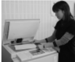
外旭川地区コミセン

(財)自治総合センターから、宝くじの収入をコミュニティ活動の発展に役立ててほしいと、旭川・飯島・樺山・寺内・外旭川・大住・旭北・川尻地区の各コミュニティセンターに、合わせて250万円の助成がありました。