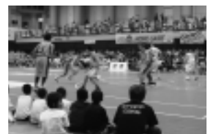
昨年は湯沢市でプロの試合を開催。1,600人が観戦

株式会社秋田ユナイテッドスポーツ(仮称) 業務 プロバスケットボールチームの設立、運営