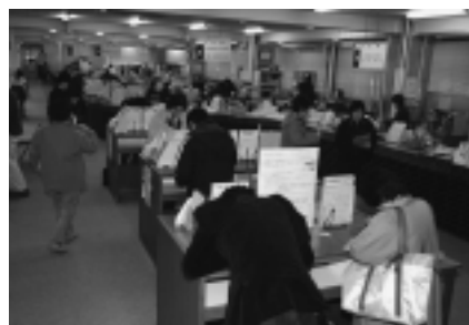
休日明けは混雑しがちです(市民課)

住民異動届の際、届け出にいられたかたの本人確認をしていますので、免許証や保険証などをお持ちください。