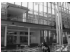
きらめき広場側にも入口