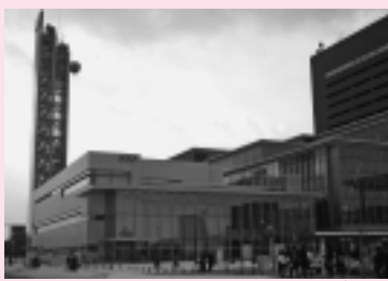
60年のアンテナタワーがシンボル