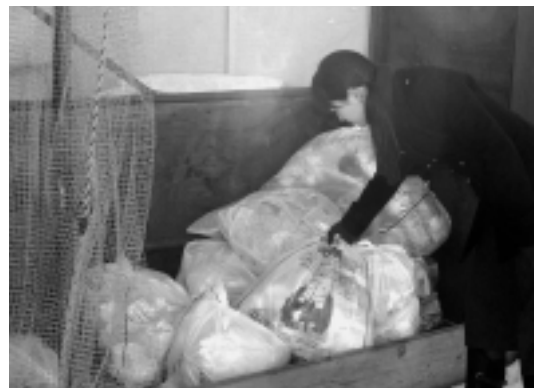
ルールを守って指定の袋でごみ出し

お近くのごみ集積所や収集日は、町内会長か近所の人におたずねください。収集日は「家庭から出るごみの分け方・出し方」(左下参照)や環境業務課ホームページでもご覧いただけます。 http://www.city.akita.jp/city/ev/cf/