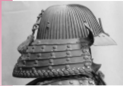
鉄鎧地六十二間片色筋兜