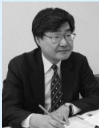
相談お待ちしております

育児、夫婦関係、DV(ドメスティックバイオレンス)、児童虐待などの相談(月～土曜日、9:00～18:00)