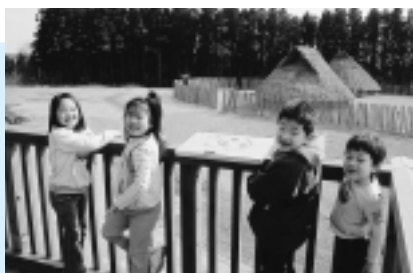
遺跡を一望できる見晴台もあるよ！