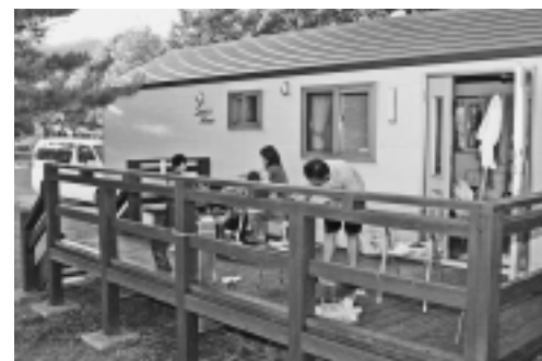
トレーラーハウス