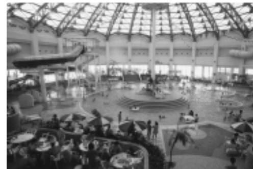
クアドームザ・ブーン