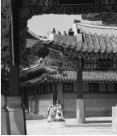
名所旧跡、おいしい料理、 そしてあたたかいおもてなし ...韓国は魅力がいっぱい!