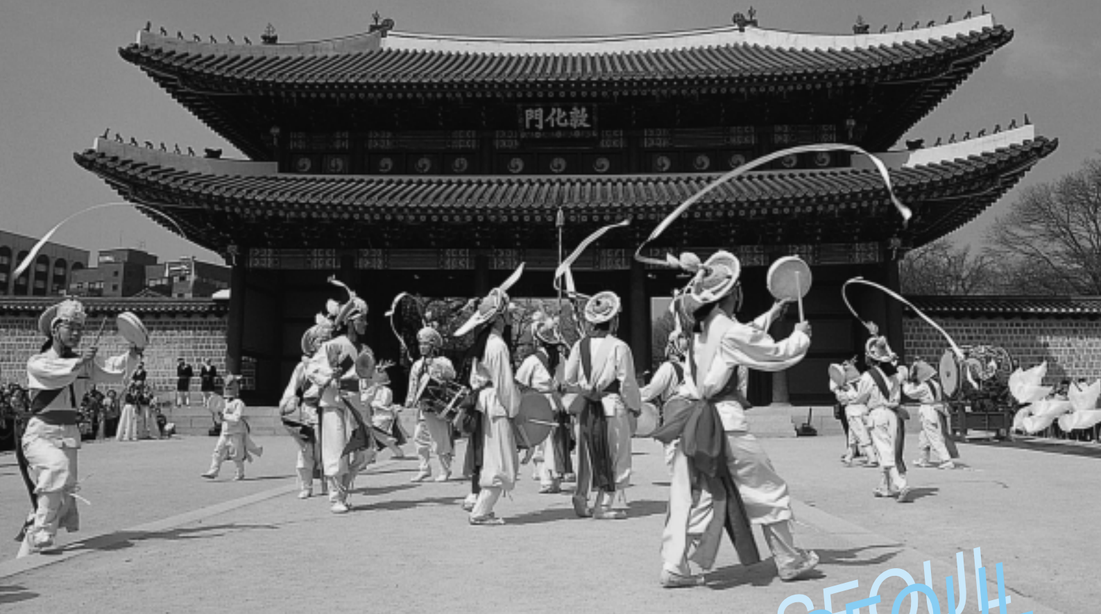
チャドクン トムアムン 李氏朝鮮時代の王宮・昌徳宮の正門「敦化門」