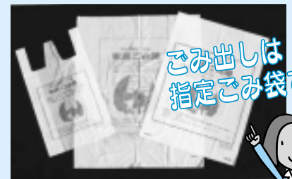
指定ごみ袋は小ささまざま

地球温暖化対策や資源循環型社会づくりのため、レジ袋削減の取り組みが全国的に行われています。秋田市でもその取り組みとして、10月から必ず指定ごみ袋でごみを出していただくことにしました。マイバッグを持って買い物に行くなど、レジ袋削減にご協力ください。ごみ減量推進課tel(866)2943