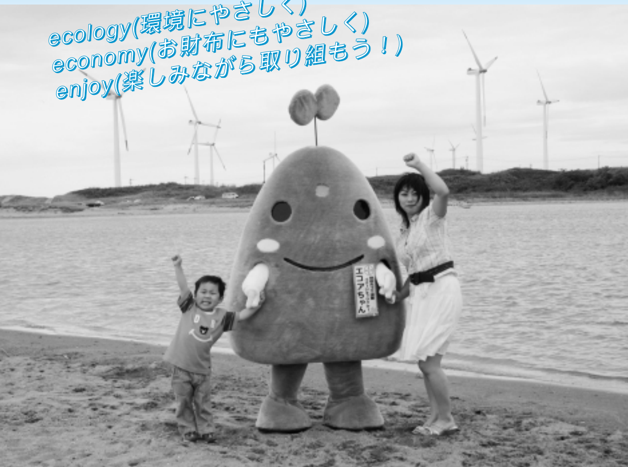
エコアちゃんと一緒にエコ生活がんばるぞ!!

ecology(環境にやさしく) economy(お財布にもやさしく) enjoy(楽しみながら取り組もう!)