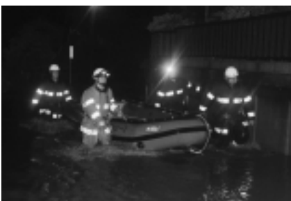
大規模災害も心配です (昨年9月の大雨)

集中豪雨、豪雪、巨大台風など、自然災害の増加 冬期間の気温上昇や積雪量の減少で雪解け水が減り、田植えの時期や夏にかけて水不足に 世界のいたるところで、自然災害や水不足によって農業が不安定に。 食料の6割以上を海外に頼っている日本では、食料の値段が高騰する可能性があります