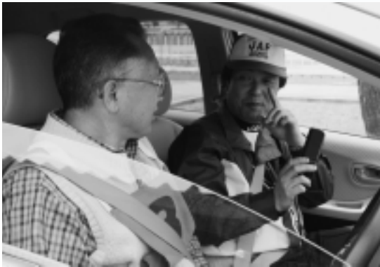
5月24日、運転免許センターで行われたエコドライブ講習会

安全に注意し、次のことを意識して運転しましょう 急発進、急加速はやめましょう… 「急」がつく操作は燃費にも悪影響 100回の急発進、急加速で約千200ccのガソリンを消費します アクセルはジワ〜と…市街地の