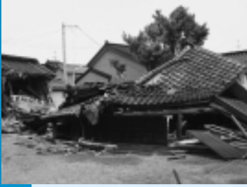
平成19年の新潟県中越沖地震で倒壊した家屋

現在の耐震基準は昭和56年に定められました。それより前に建築された住宅は、地震のとき倒壊する可能性が高くなります。今年度、市では地震に強いまちづくりのため、昭和56年以前に建てられた木造住宅の耐震診断、耐震改修の費用を支援します。