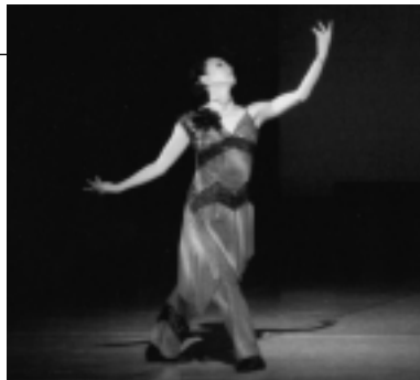
モダンダンス「Shi Ma U Ta(しまうた)」

現代風にアレンジされた楽曲「鳥唄」にのり、自然に対する畏敬の念と、自然と共存することでも育まれた「日本の心」が、巧みなテクニックで表現されています。邦舞を思わせるしなやかな動きによるダンスは、技術的な面においても作品全体の芸術性においても非常に優れており、魅力ある作品です。