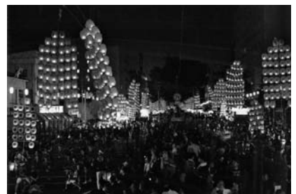
昨年の推薦作品「賑わい」