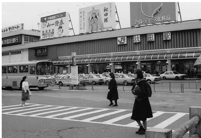
あなたのまぶたに浮かぶ秋田は？(平成元年の秋田駅前)

秋田市では「きずなでホットしていあきた寄附金」を受け付けています。これは、生まれ故郷などの自治体に寄附をした場合、税金が控除・軽減され、事実上ふるさとに納税したことになる制度(ふるさと納税制度)です。生まれ育った秋田を思う気持ちを、この制度でかたちにしてみませんか。