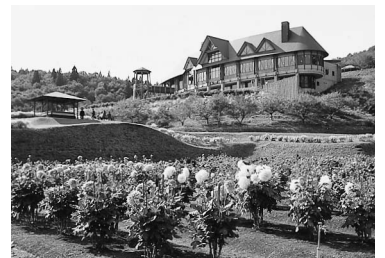
秋田国際ダリア園

申し込み 往復はがき(1通2人まで)に見学希望日、住所、氏名、年齢、電話番号を書いて、9月5日(金)(必着)まで、〒010-8560秋田市役所市民相談室☎(866)2039へ。電話、ファクス、Eメールでは受け付けません。