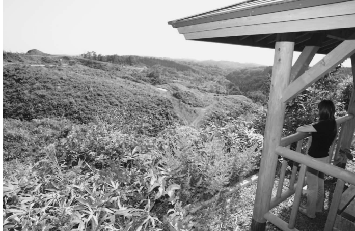
市民の森は広さ16%。遠く日本海も望めます。