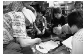
楽しいね！(岩見三内小)