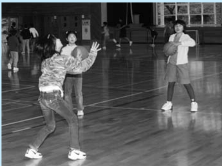
友だちや家族と一緒に！(勝平小学校)