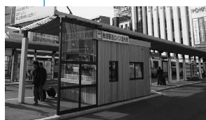
バス乗り場を秋田杉でお化粧(秋田駅西口)

中央：「秋田駅西口周辺」「千秋公園周辺」など 東部：「太平山への眺望」「幹線道路沿い」など 西部：「大森山等市街地を囲む丘陵地」「海岸沿いの景観」など 南部：「御所野ニュータウン」「仁井田の田園風景」など 北部：「秋田港周辺」「並木道」など 河辺：「旧羽州街道」「へそ公園からの眺望」など 雄和：「高尾山からの眺望」「雄物川」など