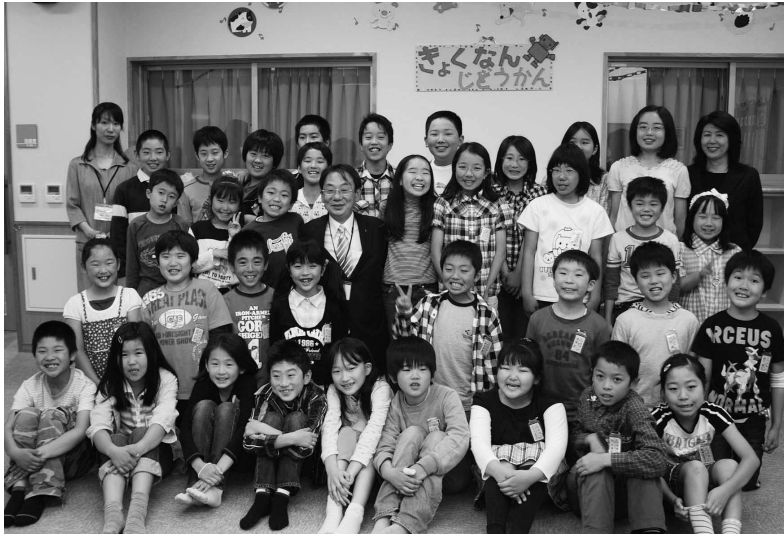
新しいコミセン・児童館ができてうれしいな！

6月1日、「旭南地区コミセン・旭南児童館」が開館しました。コミセンと児童館の機能を併せ持った複合施設としては、川尻地区に続き、市内で2番目となります。