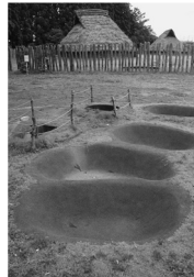
復元された弥生時代のお墓