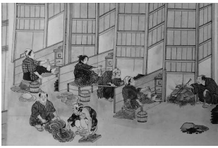
荻津勝章「秋田加護山鉦山全図并製鉦之図」