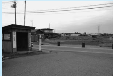
雄和コースの起点となる四ツ小屋駅前(道路の奥がバス乗り場予定地)