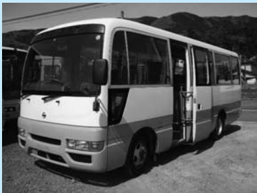
雄和A・Bコースで運行される小型バス(27人乗り) ※河辺Aコースでも同型のバスを使用します

Aコース、Bコースとも四ツ小屋駅を起点とし、雄和市民センター、大正寺郵便局を経由して、Aコースは神ヶ村西又までを、Bコースは萱ヶ沢命ヶ沢までをそれぞれ往復します。いずれのコースもこれまでのバス停で乗・降車します。