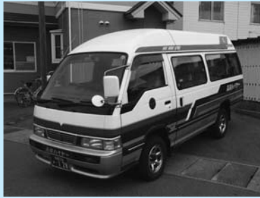
河辺コースは9人乗りジャンボタクシーと小型バスを運行(写真はジャンボタクシー)

御所野の新都市交通広場(イオンモール秋田)を起点とし、和田駅を経由して岩見三内までを往復するAコース(小型バス)と、岩見三内バス乗り場を起点とし、鶴養殿淵、岩見ダムなどを巡回するBコース(予約式乗合タクシー)で運行します。いずれのコースもこれまでのバス停で乗・降車します。