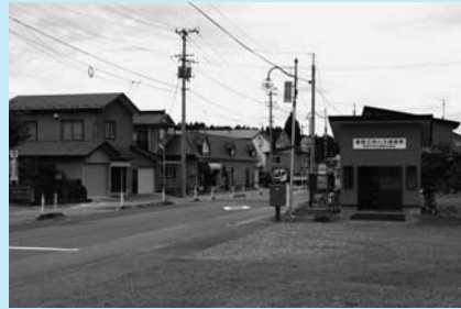
河辺Bコースの起点・岩見三内バス乗り場