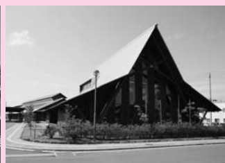
秋田県ゆとり生活創造センター「遊学舎」 上北手荒巻