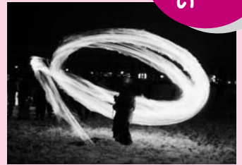
火振りかまくら (写真は仁井田)

五穀豊穡を願う伝統行事「火振りかまくら」を千秋公園お堀の水上特設ステージで行います。披露してくれるのは仁井田地区振興会と仙北市観光課のみなさん。水面に映る美しい炎をご覧ください。飛び入り体験も歓迎! 名人の指導で、あなたも伝統の継承者になりませんか?