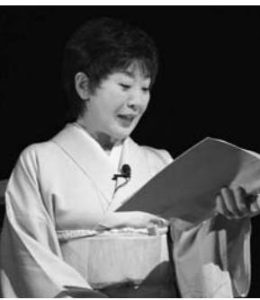
120周年記念式典での朗読

功績 秋田弁での芝居「貞子秋田おばこ物語」、一人芝居「足の裏の神様」など、女優として多彩な活動を行う一方、「秋田の応援団文化会議」発起人として秋田を応援。市制100周年式典では解説者として、市制120周年式典では作品朗読で式典成功に貢献しました。 ひとこと …駅前で生まれ、明治生まれの祖父母に育てられた私の中の秋田は不滅です。秋田を愛した祖父母への恩を果たすため、これからもずっと秋田を想い続けます。