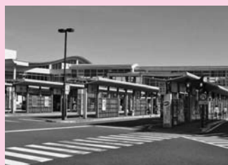
秋田駅西口前広場バス乗り場 (中通二丁目)