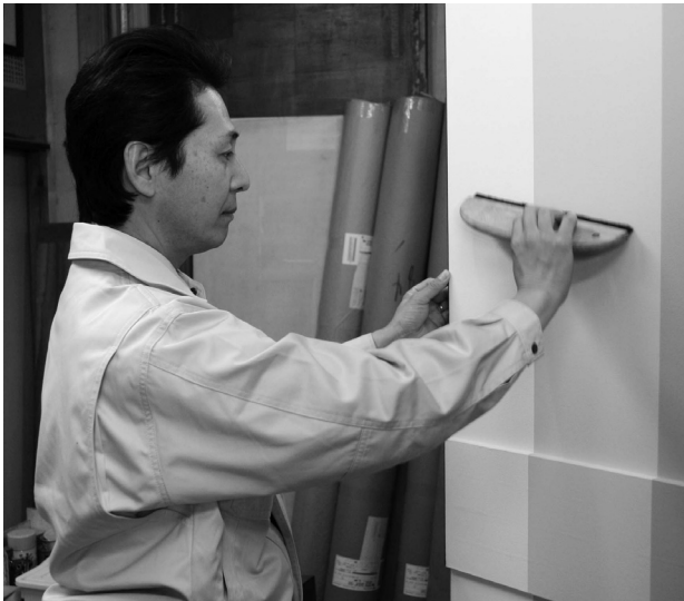
下地から仕上げまで丁寧に