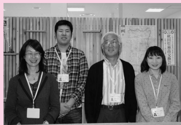
まちの情報は「まちの案内人」におたずねください