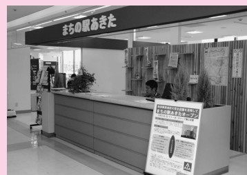
まちの駅の情報案内窓口で