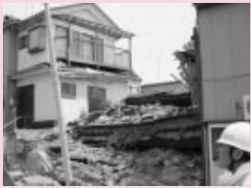
平成19年の新潟県中越沖地震

市では、昭和56年5月31日以前に建てられた木造一戸建て住宅の耐震診断、耐震改修の費用を補助します。