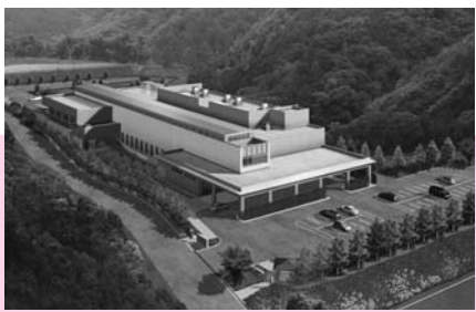
新しい斎場の完成予想図。2階建てで、12基の火葬炉を備えます(現在は6基)