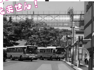
買い物広場バス乗り場