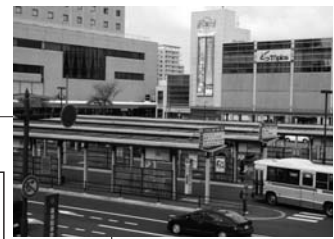
秋田駅西口バス乗り場

問い合わせ まちづくり整備室 ☎(866)2156 秋田中央交通(株) ☎(823)4413