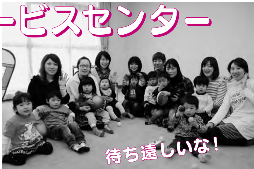
雄和の子育てサークル「ダリアキッズ」のみなさん。 「みんなで子育て交流ひろばへ遊びに行きます！」