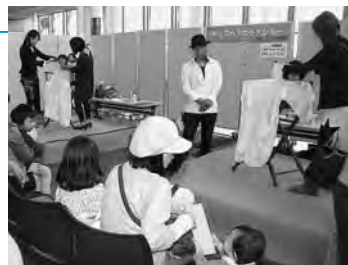
昨年のイベント「キッズへアカットショー」

問い合わせ 市民協働・地域分権推進課☎(866)2785 http://www.city.akita.akita.jp/city/copr/