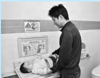
ホームック茨島店の多目的トイレ

市では、授乳やおむつ替えに立ち寄れる施設などが分かる「赤ちゃんのえきマップ」を作成します。このマップに掲載する、子連れのかたが利用できる設備があるお店・事業所を募集しています。