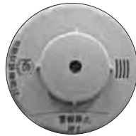
住宅用火災警報器 (一例)