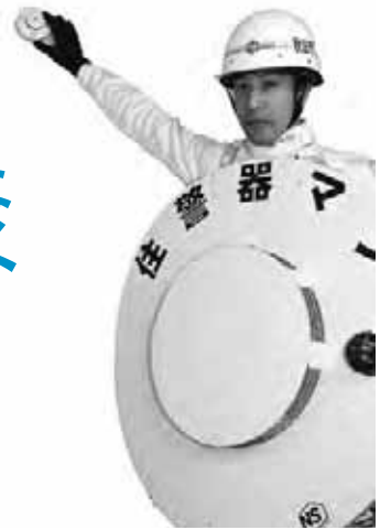
住宅用火災警報器の広報担当「住警器マン」