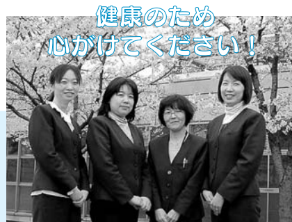
秋田市保健所の保健師

健康のため 心がけてください！ 1日8,000歩を心がけましょう たばこの害を正しく理解しましょう 節度ある飲酒を心がけましょう ▶飲酒の適量を知り、守りましょう。