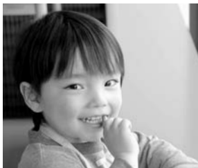
みんな頑張ったネ！