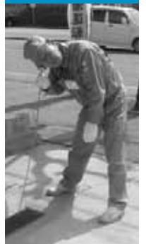
漏水による振動音の有無を音聴棒で確認

上下水道局では、6月上旬から11月下旬まで、左記の地区で道路や宅地内の水道管の漏水調査を行います。秋田市上下水道局発行の身分証明書を持った委託会社の調査員が伺った際はご協力をお願いします。ご不在の場合でも水道メーターを調査することがありますのでご了承ください。なお、この調査で費用を請求することはありません。