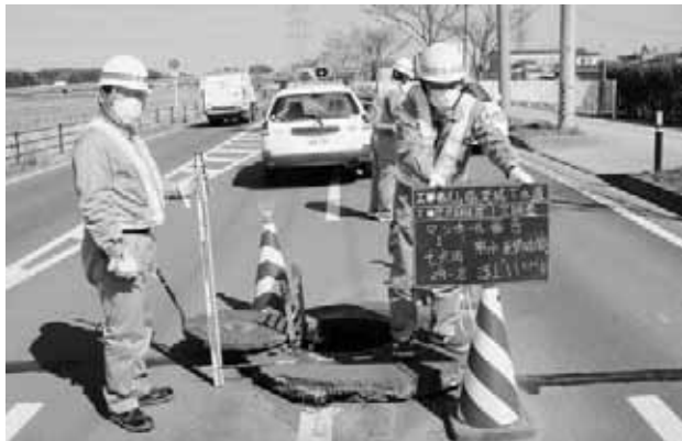
宮城県多賀城市で下水道管の被害状況調査(4月6日)