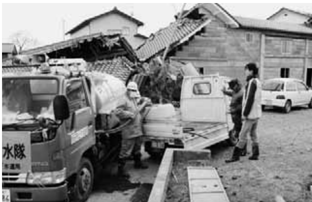
宮城県名取市で応急給水活動(4月3日)

上下水道局では、東日本大震災による被災地への応急給水活動や下水道管の被害状況調査などを行っています。