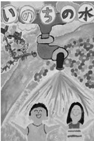
平成22年度 最優秀賞作品

9月10日(土)から19日(月)まで、秋田駅西口のフォンテAKITA 7階にある「まちの駅あきた」で、応募いただいたすべての作品を展示します。