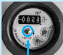
ここが回転しているか確認

じゃ口を閉めてもパイロット部分が回転している場合は漏水の可能性があります。回転していなくても「最近、水道料金が増えた」など、不安を感じたら上下水道局お客様センター計量係へお問い合わせください。☎(823)8431