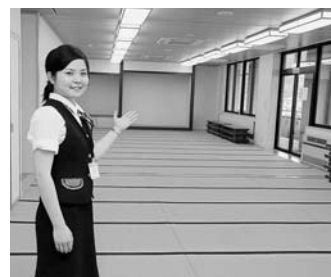
センターの3階にあります