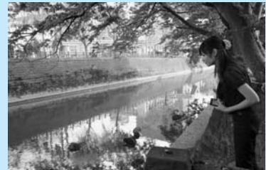
那波家の水汲み場