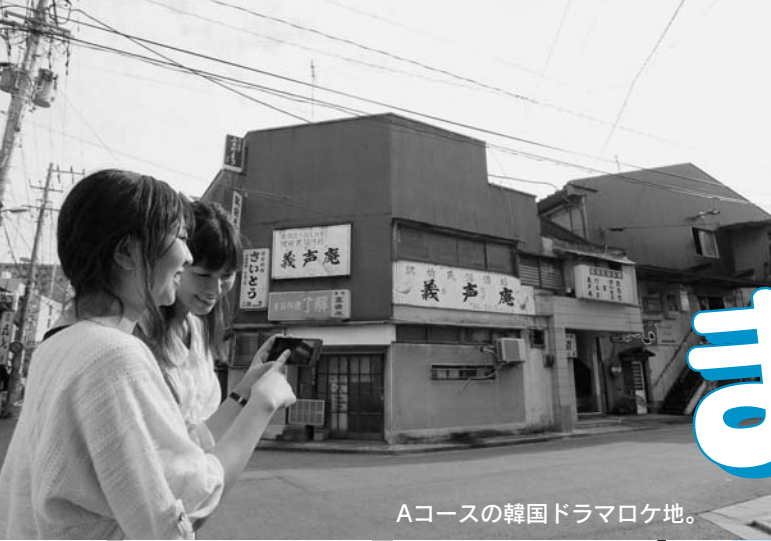
Aコースの韓国ドラマロケ地。