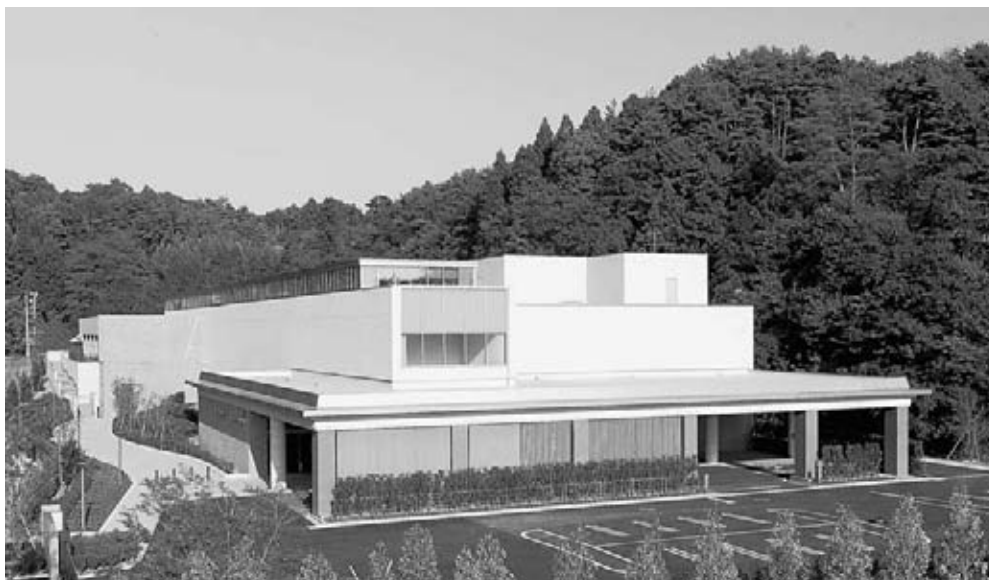
新しい斎場。2階建てで、12基の火葬炉を備えます(現斎場は6基)。

今後の火葬需要への対応や現在の施設・設備の老朽化のため、新しい斎場を建設しました。新斎場は11月1日(火)から供用を開始し、現在の斎場と雄和火葬場は閉場します。