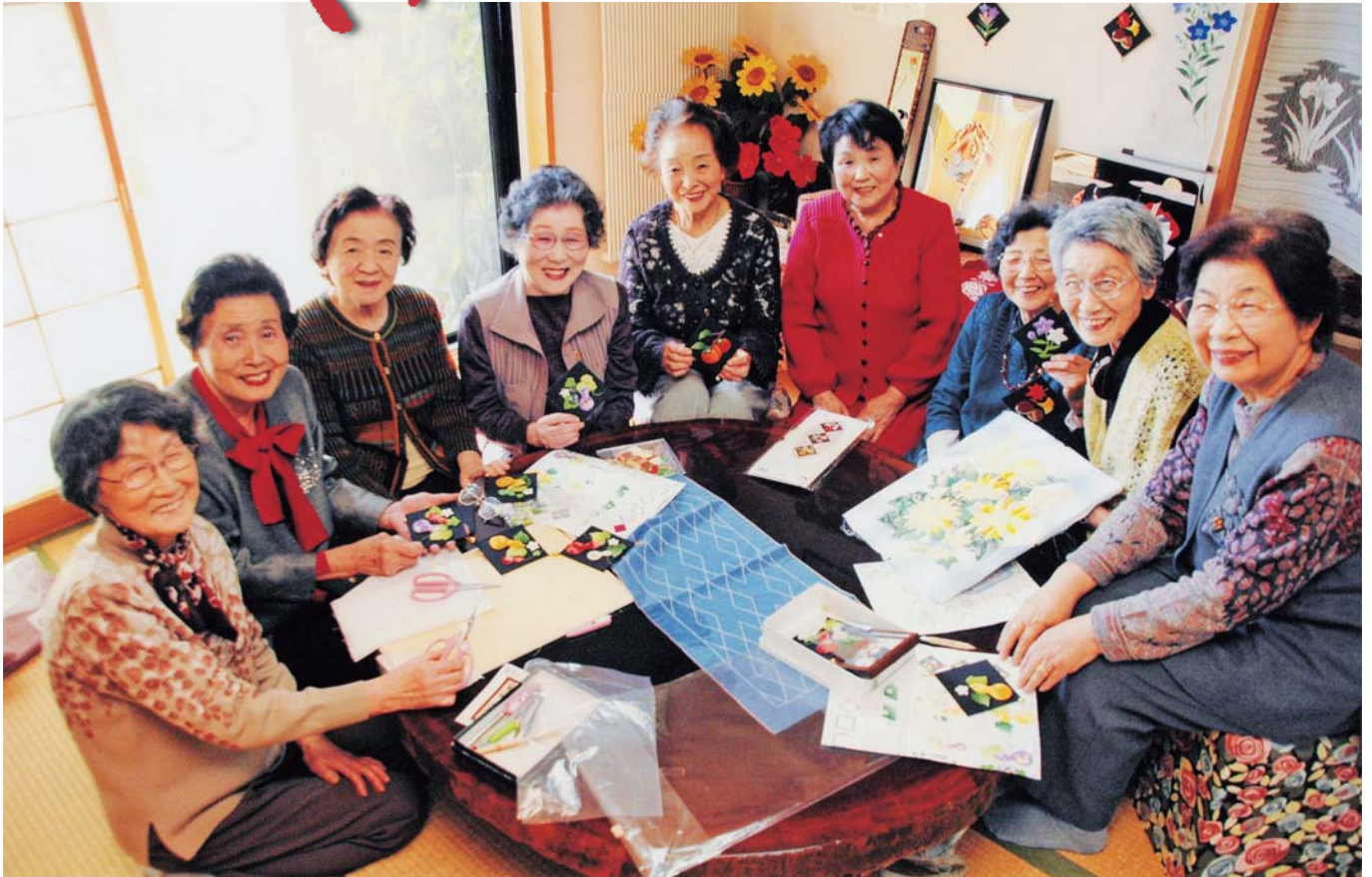
友人たちとの時間が元気の秘けつ! ➡ 11ページ