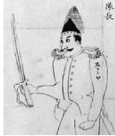
ペリー浦賀来航之図(巻物の一部分。佐竹史料館蔵)

市の文化施設などが所蔵する遺物や古文書、幕末の資料などを部門ごとに紹介して秋田市の歴史をたどります。