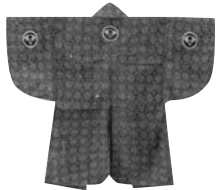
佐竹家家臣の梅津家に伝わる革羽織