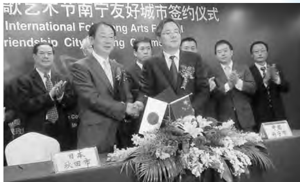
中国・南寧市と経済貿易協力に関する覚書を交換 (昨年10月)