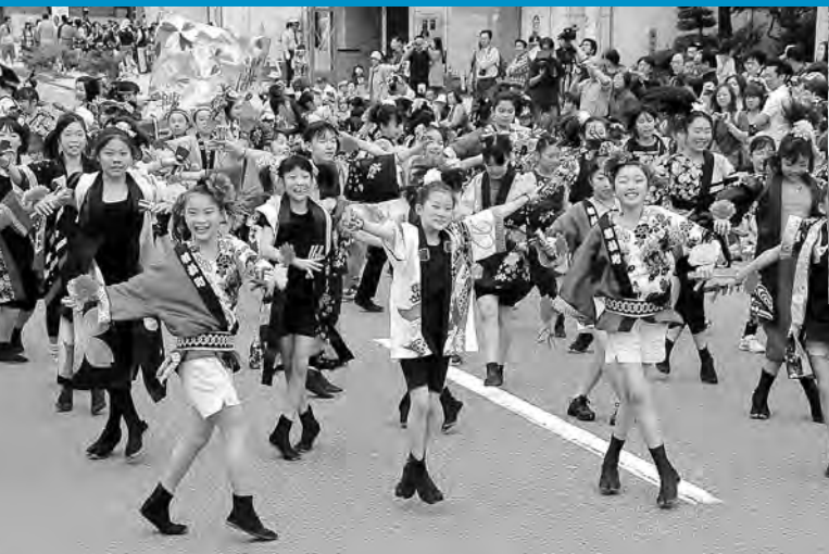
元気あふれるまちに(ヤートセ祭)