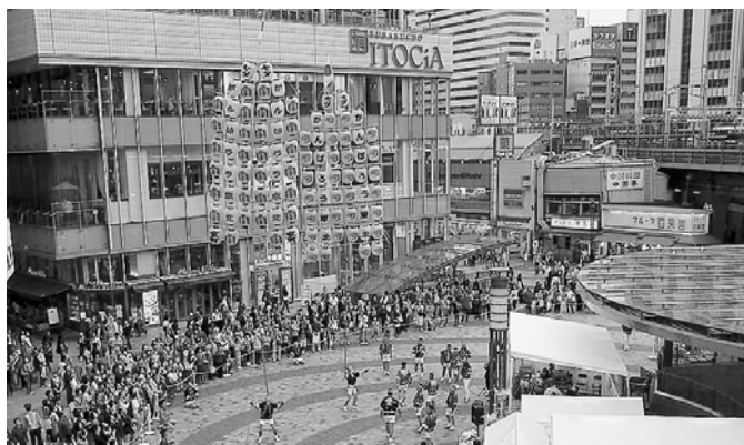
東京有楽町駅前で行った竿燈をPR(昨年10月)