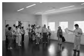
6月29日に行われた施設見学会