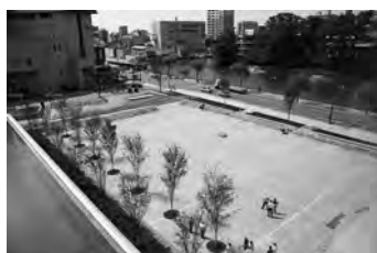
屋外イベントに。にぎわい広場