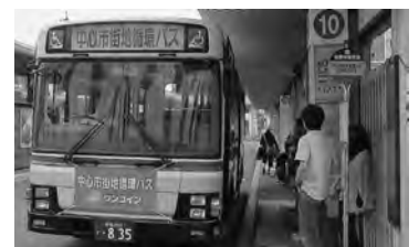
バス前面の横断幕が目印！

「エリアなかいち」のにぎわいを中心市街地全体に波及させるための循環バスを、来年2月末まで試験的に運行しています。ぜひご利用ください。