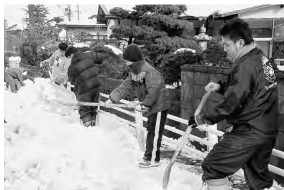
地域で除雪(今年1月、外旭川で)