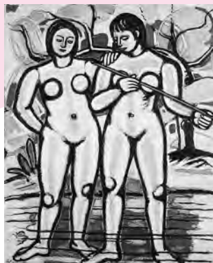
金沢秀之助「丹塗の矢」