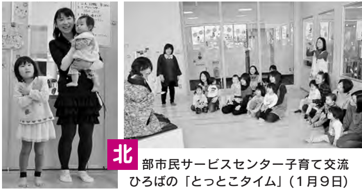
北 部市民サービスセンター子育て交流 ひろばの「とっとこタイム」(1月9日)

*スペースの都合などにより掲載依頼があったものすべてを掲載できない場合があります。ご了承ください。