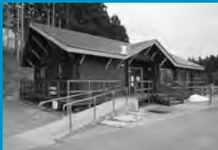
事務所は御所野学院側