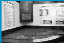
映像と模型の解説