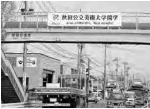
地域に掲示された横断幕