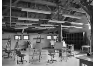
改修された創作工房