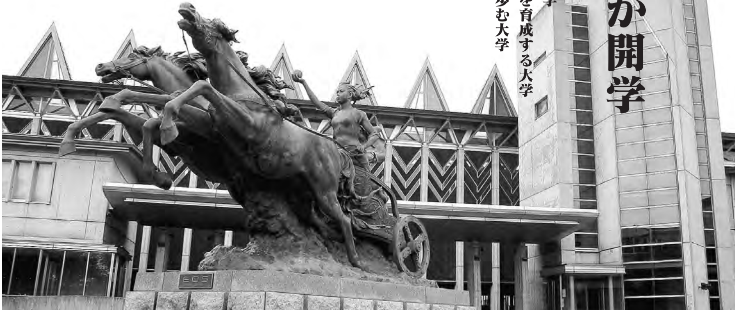
*入学式の様子は次号の広報あきたで紹介します。

地域とつながり、新たな価値観を世界に発信する芸術・文化の拠点として大いに期待される秋田公立美術大学。これからどんな人材を育て、輩出していくのか今から楽しみです。