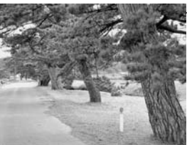
能代市松山の松並木